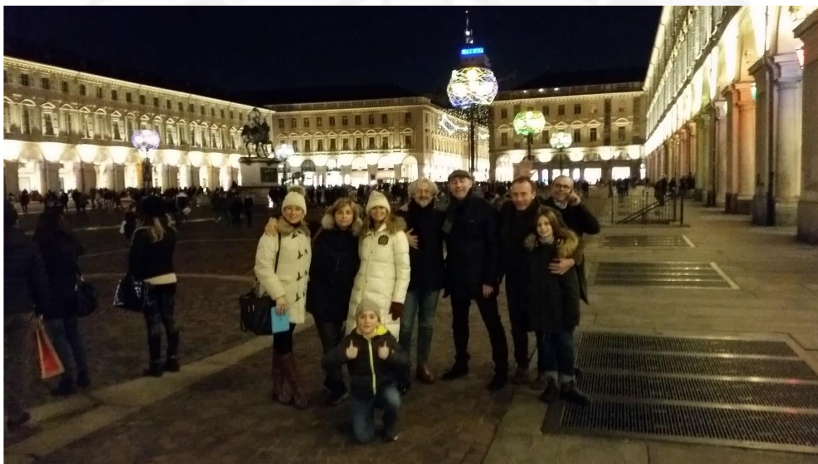
Passeggiata dopocena in Piazza San Carlo