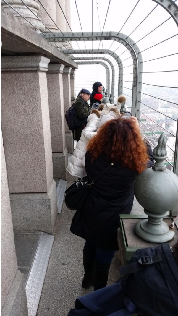
Sulla sommità della Mole Antonelliana.