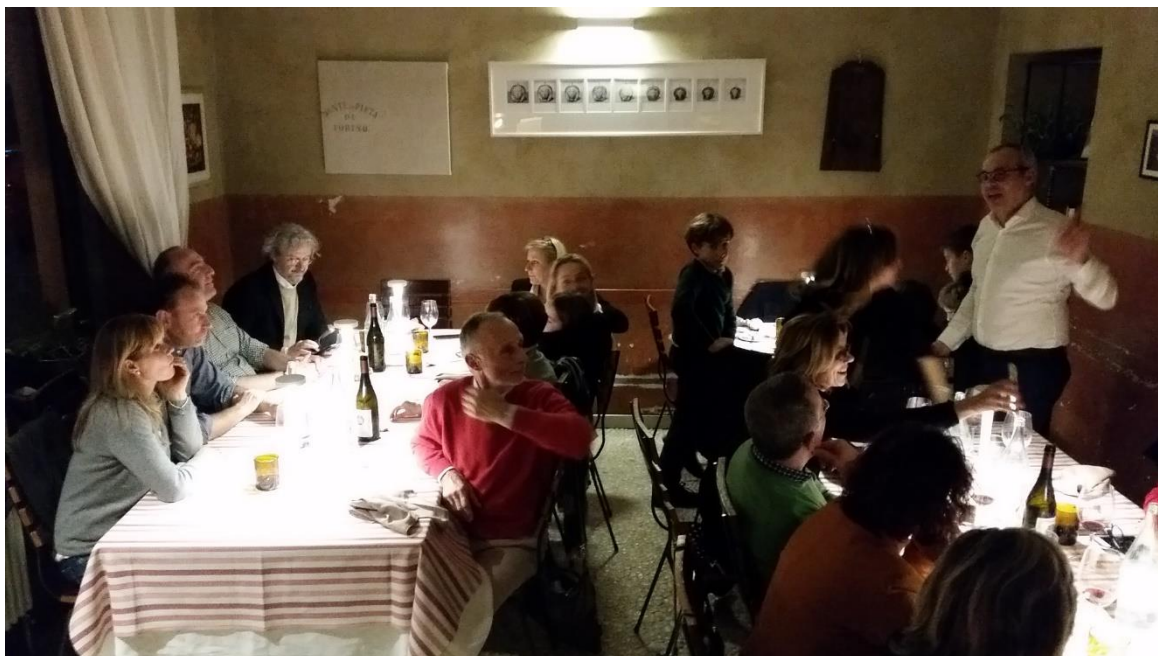
Al termine della cena non è mancato il discorso del Presidente...