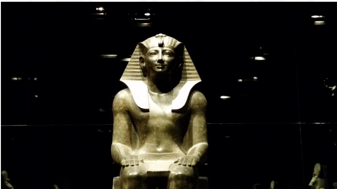
Statua di un faraone all'interno della sala "Riflessi di Pietra" allestita dallo scenografo Premio Oscar Dante Ferretti in occasione delle Olimpiadi di Torino 2006