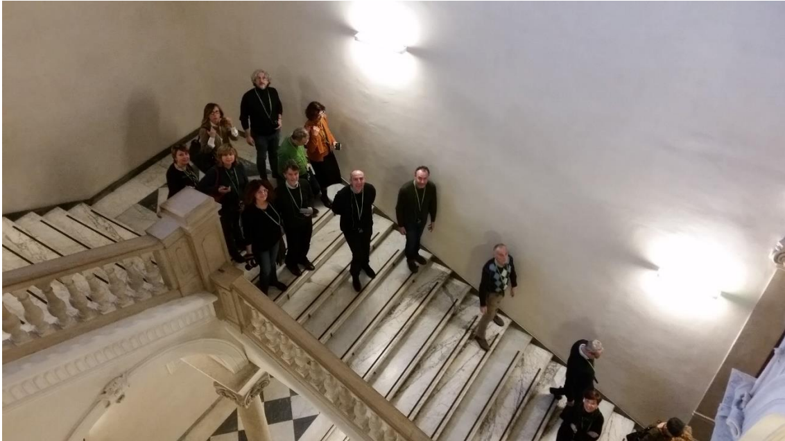
Sulla scalinata all'interno dell'edificio che ospita il Museo Egizio