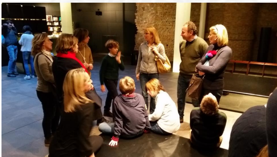
In attesa della guida prima di iniziare la visita del Museo Egizio