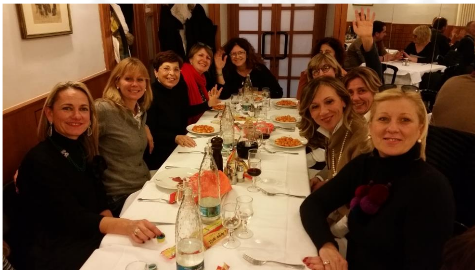
A pranzo in un ristorante della centralissima via Carlo Alberto.

Il 13 e 14 gennaio 2018 si è svolta la gita a Torino. E' stata una bella occasione per visitare una splendida città e per consolidare l'amicizia e l'affiatamento tra i soci, i quali hanno potuto ammirare alcuni tra i numerosi tesori del capoluogo piemontese. In tale circostanza è stata in particolare organizzata una visita guidata al Museo Egizio e al Museo del Cinema, collocato quest'ultimo nella splendida cornice della Mole Antonelliana, ed una piacevole passeggiata nelle vie e piazze centrali della città: via Lagrange, piazza Castello, piazza San Carlo ed altre ancora. La visita si è conclusa con una escursione sul Monte dei Cappuccini, collina sopra Torino, dalla quale è stata possibile ammirare una suggestiva vista dall'alto della città.