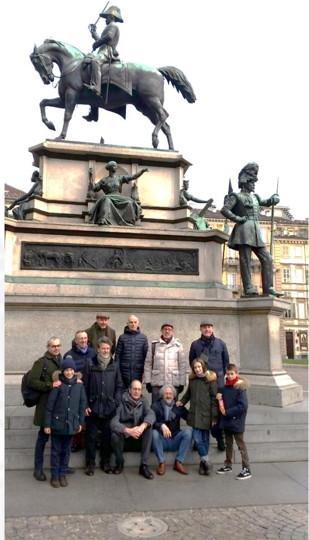
I partecipanti in Piazza Carlo Alberto....